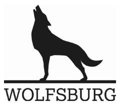
BILD UNGS HAUS WOLFSBURG