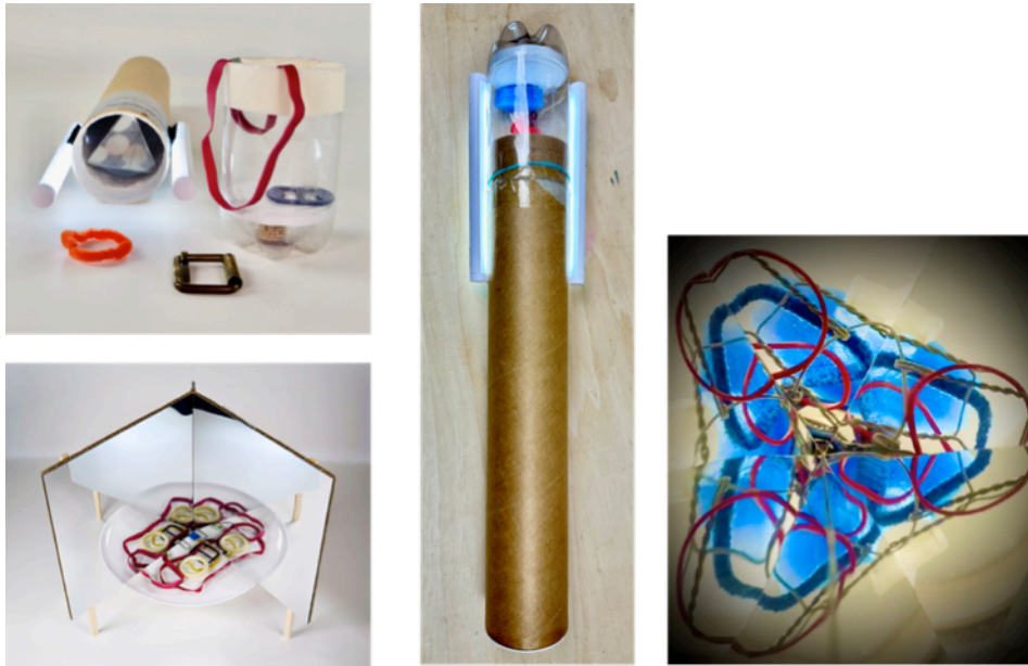
Abbildung 28: Spiegelsymmetrie mit Wechselkaleidoskop, Drehteller und Klappspiegel - Idee + Fotos Brée

Das Entdecken und Experimentieren mit und von Spiegelphänomenen gehört zu den spannendsten Erfahrungen für Kinder – sowohl als physikalisch-mathematische als auch als ästhetische Erfahrungsform.