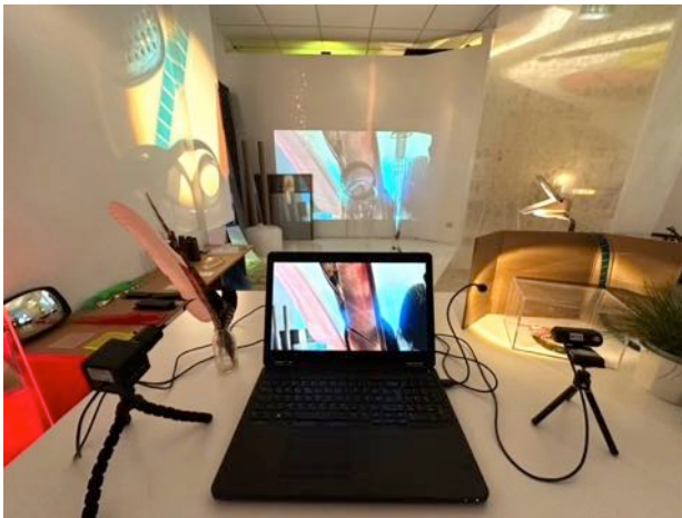
Abbildung 23: Ausstellung – „Grenzen überschreiten“ 2 Beispiele

Zwei aktuelle Beispiele aus der Ausstellung „Grenzen überschreiten“ in Bremen, 12/202 zeigen, wie die Kinder in der Reggiopädagogik in und mit multimedial ausgestatteten Lernumgebungen angeregt werden, beim Entdecken und Forschen von und mit Naturphänomenen ganz selbstverständlich "digitale Medien als Werkzeug" zu nutzen. Zu sehen waren verschiedene thematisch gestaltete Szenarien im Rahmen von Themen zur nachhaltigen Entwicklung. Beamer projizierten etwa Liveaufnahmen von in den Räumen platzierten Materialszenarien mit Videokamera und/oder Digitalmikroskop auf halbtransparente Folien. Zeitgleich und daneben wurden die Motive auf Wände projiziert. Man konnte sich so zwischen verschiedenen, digital verstärkten und Verfremdeten Perspektiven auf die Naturmaterialien bewegen. Man kann nachvollziehen, wie das Thema Nachhaltigkeit im Umgang mit Naturphänomenen auf diese multimediale Art und Weise für die Kinder sinnlich intensiv erfahrbar und dabei spielerisch veränderbar bleibt. Um diese Erfahrung besser nachzuvollziehen, lohnt es sich den virtuellen Rundgang zu nutzen - siehe QR unten auf dieser Seite.